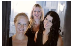
Donau und Ries)

Sonntag, 29.04.2018, 18:00 Uhr Aula der Antonius-von-Stechele-Schule Liederabend mit